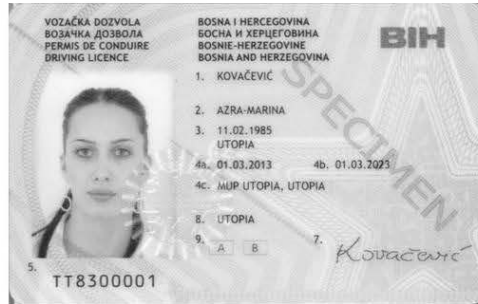
Slika 1. Prednja strana vozačke dozvole