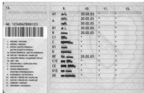
Slika 2. Zadnja strana vozačke dozvole